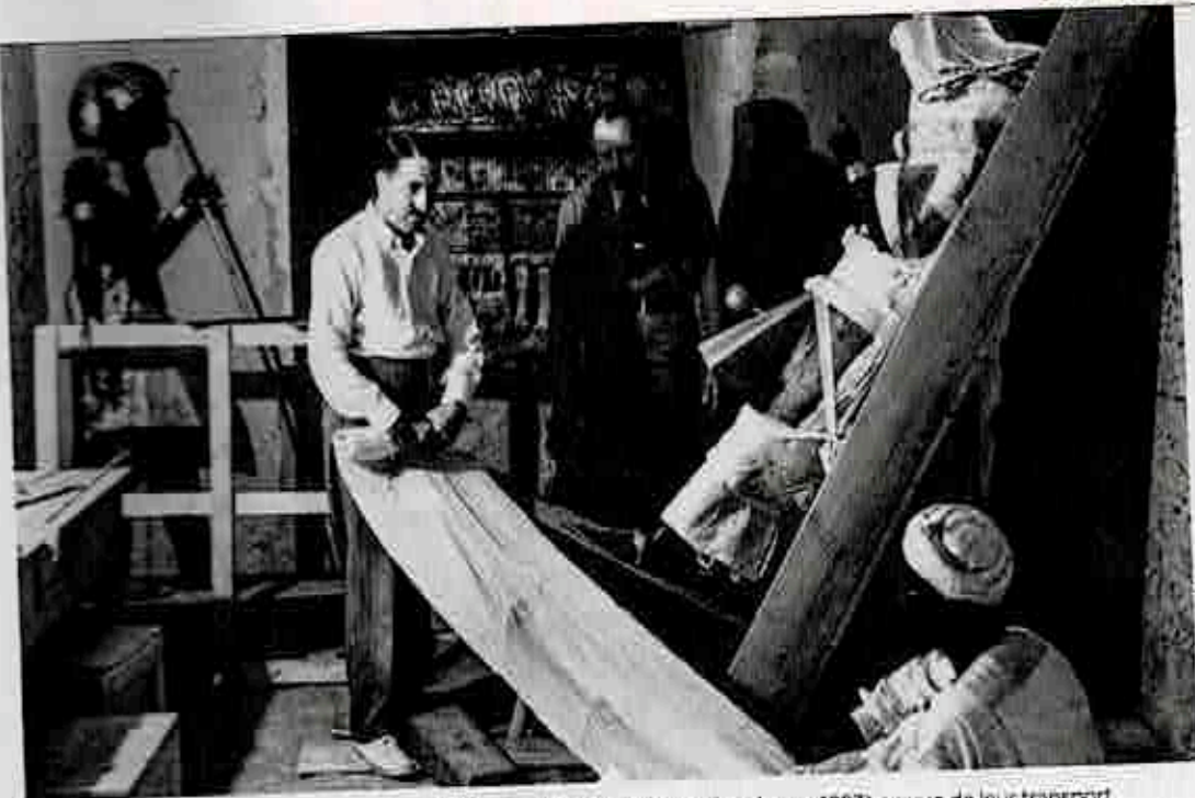
Les trésors du tombeau sont emballés par Howard Carter (à gauche, en 1923) en vue de leur transport au musée du Caire. L'égyptologue a longtemps été soupçonné d'avoir sorti illégalement des objets du site, rumeur que des éléments récents viennent d'étayer.