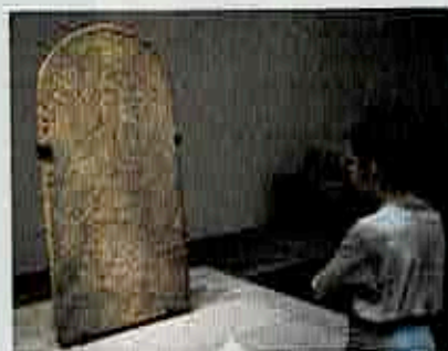
Les certificats d'origine de la stèle du Louvre Abu Dhabi seraient des faux.

Aujourd'hui encore, le nom de Toutankhamon est associé à des trafics. Pour preuve, le scandale déclenché en mai 2022 autour d'une stèle en granit rose d'Assouan dite de Toutankhamon, haute de 1,66 mètre et exposée depuis son inauguration en 2017 au Louvre Abu Dhabi. Il s'agit d'un rare décret royal remontant au règne de Toutankhamon (1336-1327 avant J.-C.). Il a été acquis en 2016 avec six autres objets d'art égyptien par le Louvre Abu Dhabi, pour une valeur totale de 50 millions d'euros. Mais ses certificats d'origine seraient faux. Quand la stèle est-elle sortie d'Égypte ? Entre 1933 et 2011, selon les versions... Et comment ? C'est tout le cœur d'une affaire complexe dans laquelle hommes de paille, experts, conservateurs manquant de